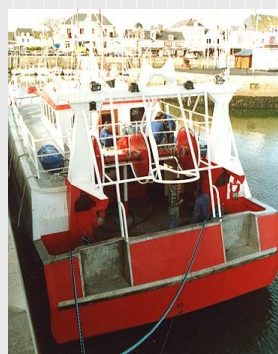
Boîtes à poids sur AR RAOK