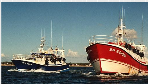
Pêche en bœuf